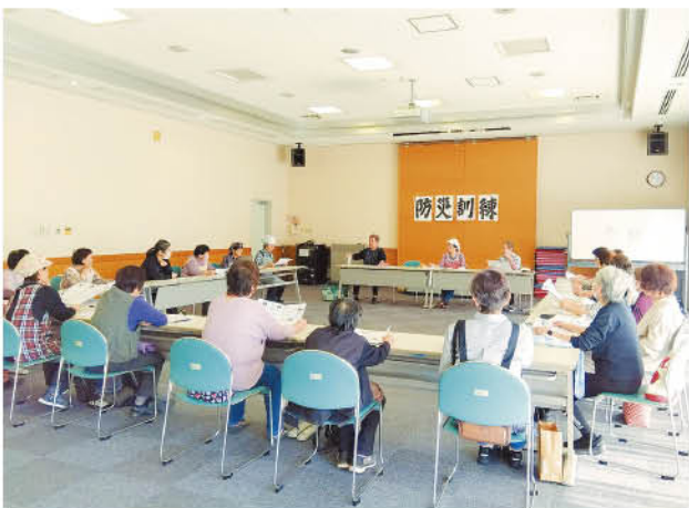
▲講師も自前なのが西浜おさんぽばーじーず。メンバーの趣味や特技、経験を活かし、「誰もが活躍できる場」に!

続いての防災食(パッククッキング)作りでは、ごはん、親子丼の具、かぼちゃの煮物、蒸しパン、ツナとトマトのスパゲッティの5種類を一齐にお湯を沸かした鍋に投入。気心の知れたメンバーならではのチームワークの良さが際立ちます！待ち時間には、新聞を使ったお皿作りと盛りだくさん。みんなで災害への意識を高める時間になりました。